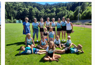
Kinder Wettkampf Bühlertal 2022