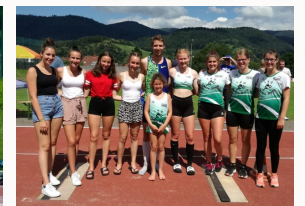
Springen mit Musik mit Vizeeuropameister Heinle