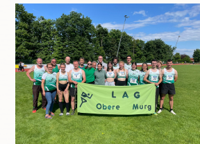
Bad. Mannschaftswettkampf Langensteinbach 2022

Wir sind der einzige Verein im Kreis, der das Stabhochsprung Training anbietet