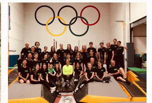
Letztes Trainingslager in Zweibrücken 2019