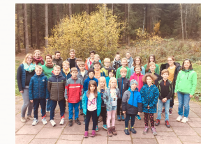
Hüttenwochenende in Herrenwies 2018

Außerhalb des Trainings, verbringen die Athletinnen und Athleten der LAG viel Zeit miteinander. Beim jährlichen Hüttenwochenende ist immer eine gute Stimmung, sowie beim Trainingslager in Zweibrücken macht es in der großen Gruppe immer viel Spaß. Auch bei internationalen Wettkämpfe wie Europäischen Meisterschaften ist die LAG im Publikum gerne live dabei.